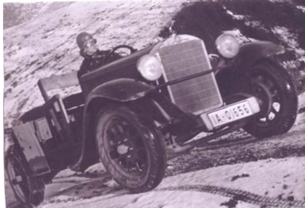
Bild 3: Gerhard Lentz am Steuer des Föttingerschen Versuchswagen 2

dem in Bild 3 gezeigten Fahrzeug statt, das eigentlich nur aus einem Mercedes-Chassis mit aufgesetzten Holzbänken bestand.