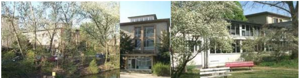
Bild 4: Ansichten des Hermann-Föttinger-Gebäudes